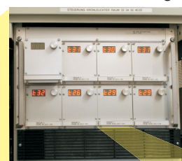
bis zu 8 Kassetten in einem Baugruppenträger mit einem Lüfter